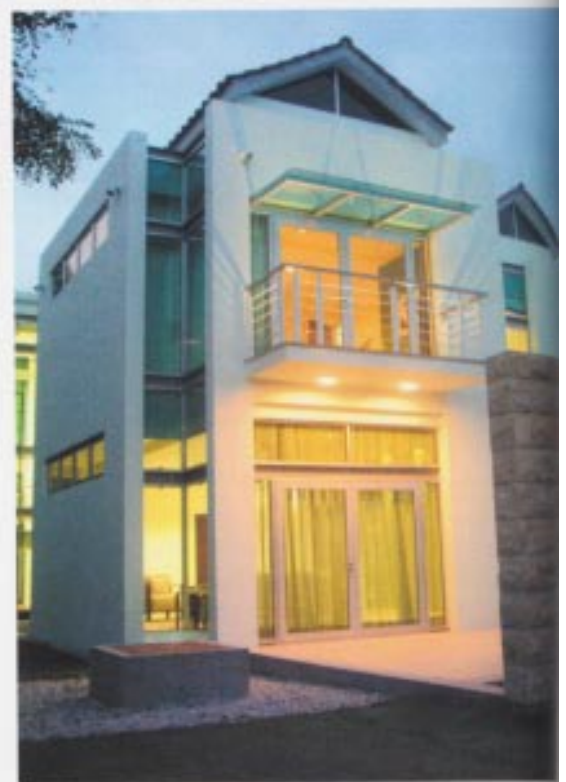
PENULIS: EMMA MASRI FOTOGRAFI: MAZLAN YUNOS